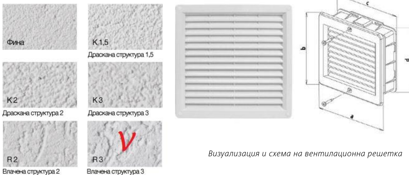
Визуализация и схема на вентилационна решетка

Визуализация структура крайно покритие (мазилки над цокъл)