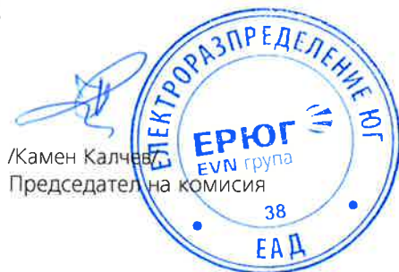
/Камен Калчев/ Председател на комисия

Потвърждаваме приемането на настоящата покана.